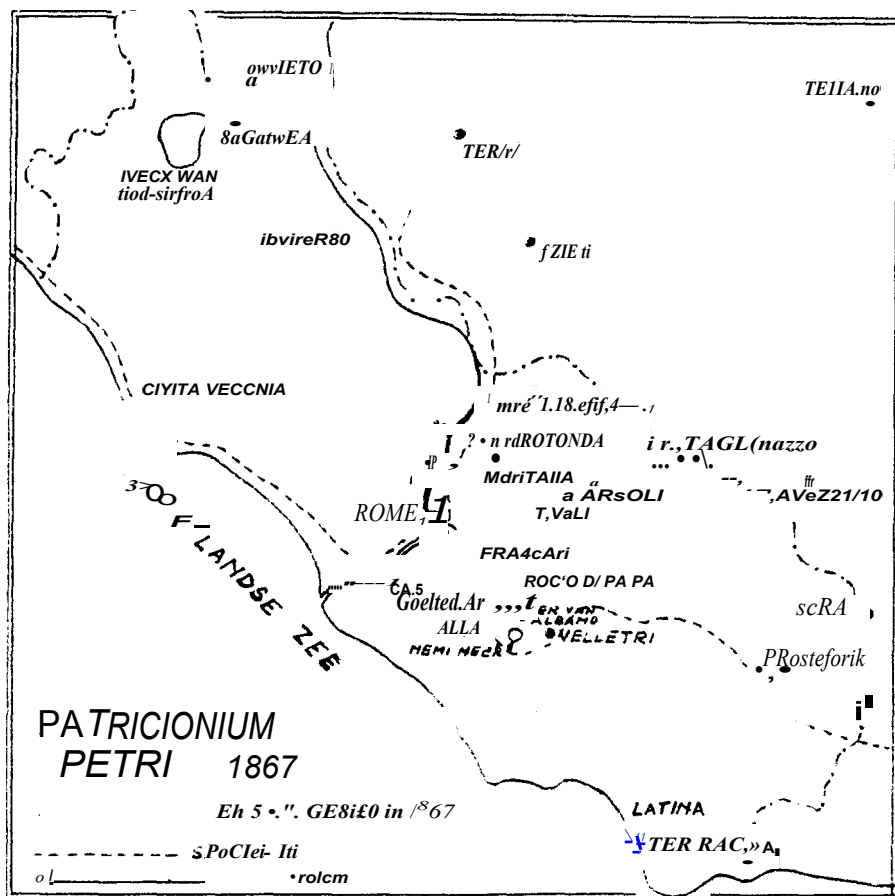
De Kerkelijke Staat, 1867