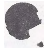
SCHEPENAKTE VAN OERLE 28 mei 1345